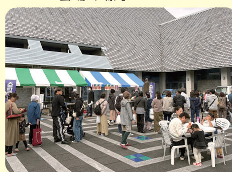
焼きサンマの行列