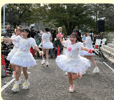
アイドルステージ