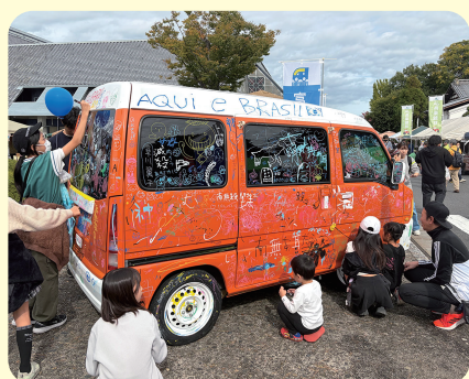
らくがきカー (有)富士協栄