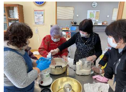
【女性部事業の様子】