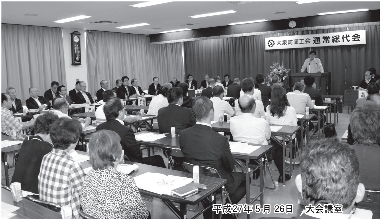
平成27年5月26日 大会議室