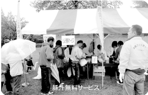
豚汁無料サービス