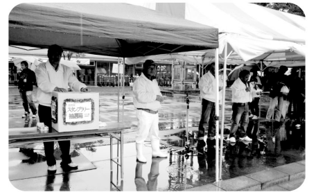
雨の中のスタンプラリー抽選会

とん汁チャリティ: 募金12,258円を 大泉町社会福祉協議会へ寄付いたしました。