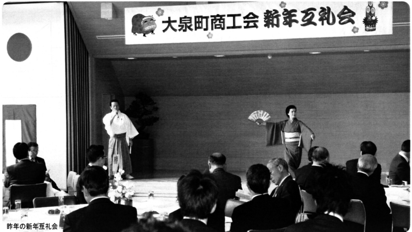
昨年の新年互礼会

商工会員数.....894 商工業者数.....1,623 内小規模事業者数.....1,301 ※組織率 55.1%