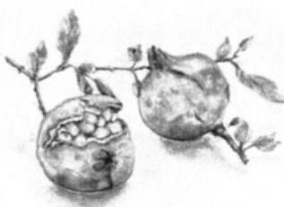
花言葉 さくろ(柘榴) 自尊心 円熟した優美、種子が 多い事から子孫の守護といわれる。

結びに、会員皆様のご多幸を祈 念いたしました。新年のご挨拶と させていただきます。