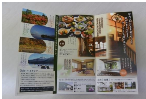
PRの強化を目的としたチラシやパンフレットの作成