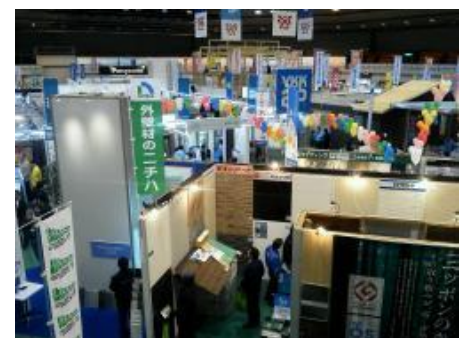
販路開拓のための展示会出展