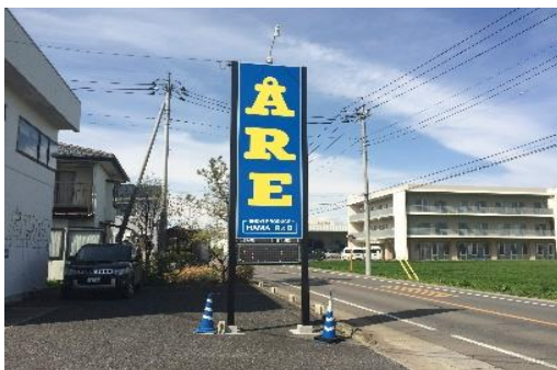
店舗の認知度向上を狙った看板(サイン)の設置