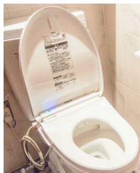
トイレの洋式化改修