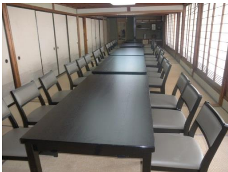
新規顧客獲得のための新設備・什器導入